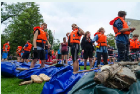
Starten ved Lyngby Mølle - Deltagerne er klar til at sætte bådene i vandet og padle 7 km. ned af Mølleåen

Mølleåejladsen er et spejder løb til vands for alle i alderen 12-99 år. Det gælder i alt sin enkelthed om at bygge sin egen båd og komme først i mål, ved at padle de 7 km. ned af åen fra Lyngby til Rådvad. Du bliver udfordret på byggeevner, samarbejde og fysisk udholdenhed (og evt. kreativitet)